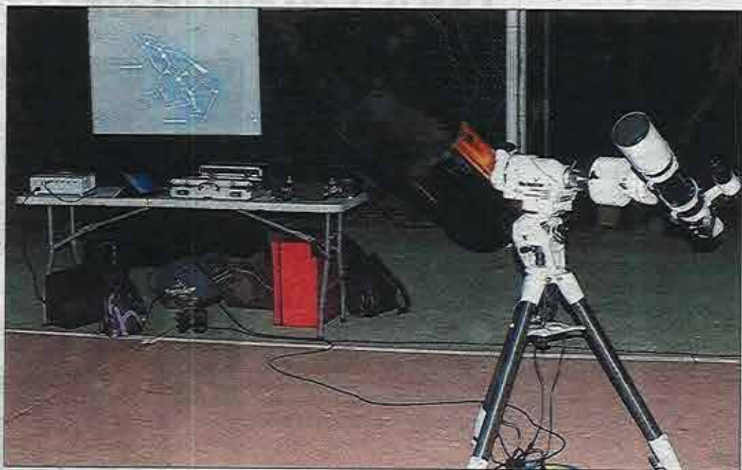
Le club dispose de tout le matériel pour observer et comprendre le ciel. L'acquisition d'un planétarium mobile et la construction d'un observatoire sont envisagées.