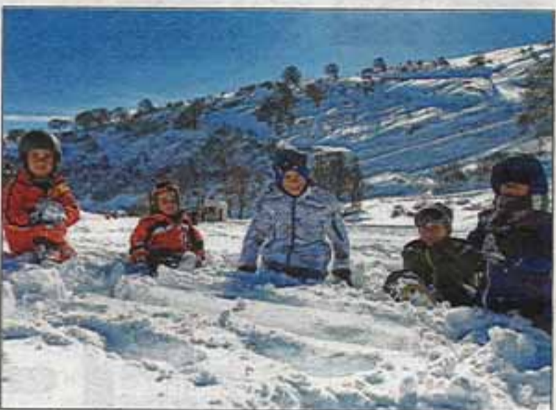
Un seul mot dans la bouche des enfants : super !