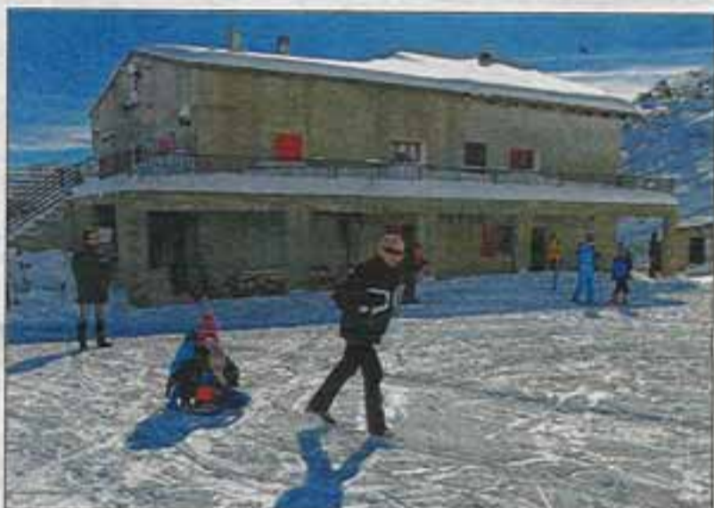
Un site idéal pour partager un bon moment en famille.

Consultez le site de la commune pour connaître les animations et les dates de sortie organisées sur www.ghisoni.fr ou la page facebook de la station : station ski ghisoni capanelle.